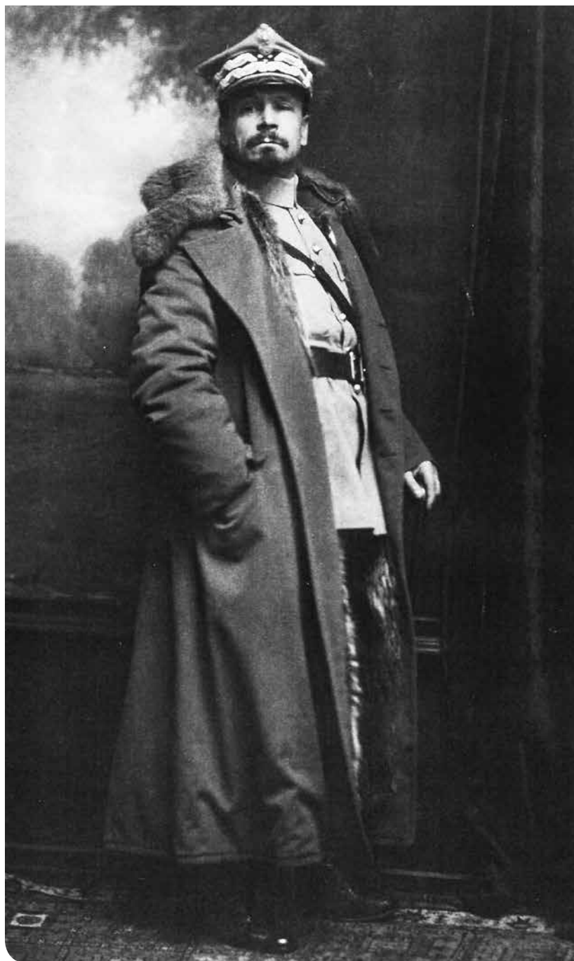
Generał Józef Haller