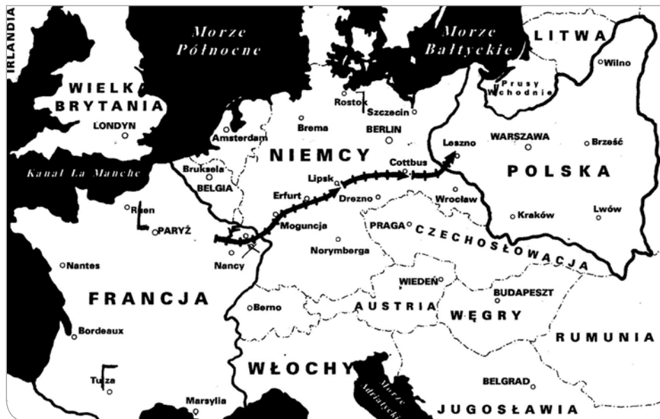
Trasa transportów armii generała Hallera do Polski w 1919 roku